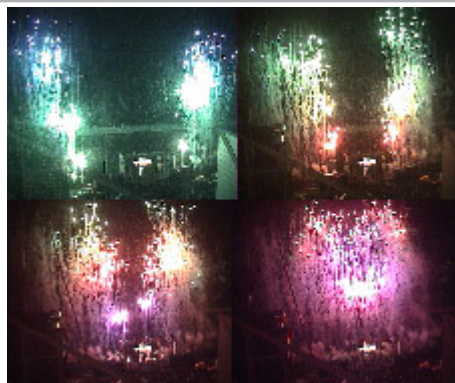
photo: タイプⅢA カラーランニング