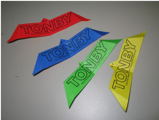
材質：紙 サイズ：W 150mm×D 35mm