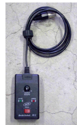
■ 専用リモコン REMOTECONTROL